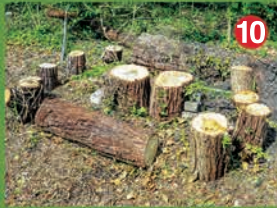
Le Laboratoire du Dehors