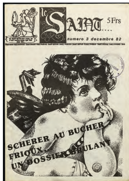
Quelques exemples de journaux étudiants réalisés à l'université Paris-VIII depuis son installation à Saint-Denis en 1980.