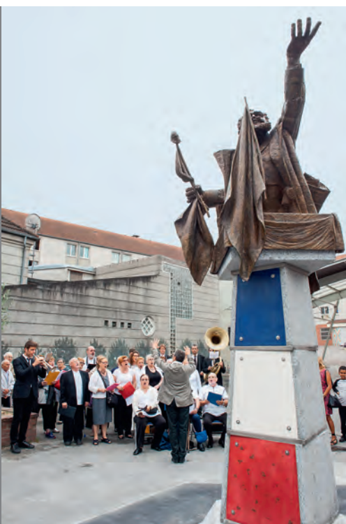
11 septembre 2016 • Pierrefitte. Pose de la statue de Jean-Jaurès sur la place du même nom. Il a fallu plusieurs années au sculpteur Virgil pour réaliser cette œuvre monumentale, financée par une souscription populaire.