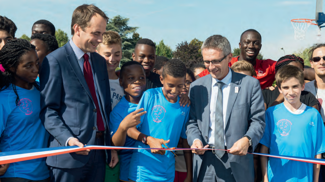
13 septembre 2016 • Montreuil. J-365 pour la Seine-Saint-Denis et ses collèges mobilisés pour la candidature JOP 2024. Ici inauguration d'un nouveau plateau sportif au collège Georges-Politzer qui bénéficiera à la fois aux élèves et aux différentes associations locales, en présence de Stéphane Troussel et de Patrice Bessac, maire de Montreuil.