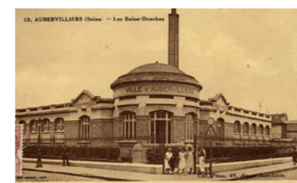
Les bains douches, Aubervilliers